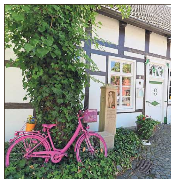
Kaffee und Kuchen im historischen Fachwerk genießen, nachdem Behördengänge und Einkäufe erledigt sind: Dies ist dank des Dorfbusses auch ohne Auto möglich.