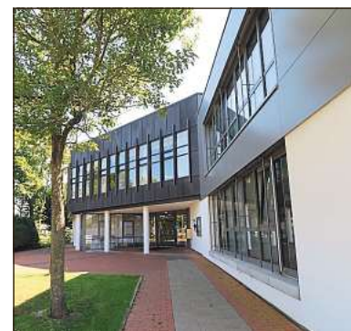
Die Haltestelle am Rathaus bleibt weiter, auch wenn die öffentliche Bücherei geschlossen ist. Das Bürgerbüro im Verwaltungsgebäude kann mit dem Dorfbus so bestens angesteuert werden.

an der Hauptstraße (Nordseite), am Altenheim, am Blumenweg in der Nähe zum Friedhof, an der Friedenskirche, am Rathaus (Südseite), an der Ziegeleistraße, an der Bäckerstraße, der Ulmenstraße, am Allerbecker Weg, an der Kindertageseinrichtung, Himmelszelt, am Feuerwehrhaus (Ost), am Rathaus (Nordseite), am Café „Zur Linde“ und der Langenberger St.-Lambertus-Kirche, der Südseite der Hauptstraße und dem E-Center. Neu im Dorfbusangebot ist: Hunde dürfen unter bestimmten Bedingungen ebenfalls mitfahren.