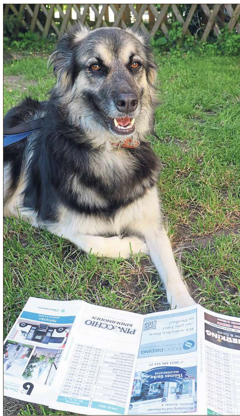
„Also ich nehme dann den Dorfbus um 10.30 Uhr, müssen wir da noch lange warten?“ Hündin Kathi ist schon gespannt, wie ihre erste Fahrt verlaufen wird.