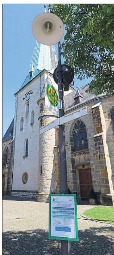
Zentraler geht nicht: Eine Haltestelle befindet sich direkt am Haupteingang der Pfarrkirche St. Lambertus.

Rund 30 Haltestellen werden werktags sozusagen kreisförmig bedient. Zu festen Zeiten, auf die Verlass ist, auch wenn einmal der eine oder andere Bedarfshalt eingelegt wird. Die ersten drei Monate haben gezeigt, wo Kleinigkeiten zu ändern sind. Statt am Siedlungsrand fährt der Dorfbus an einigen Stellen nun mitten hinein in Wohngebiete in kleinen Schleifen, die nicht länger dauern, aber kurze Gänge zu Haltestellen ermöglichen.