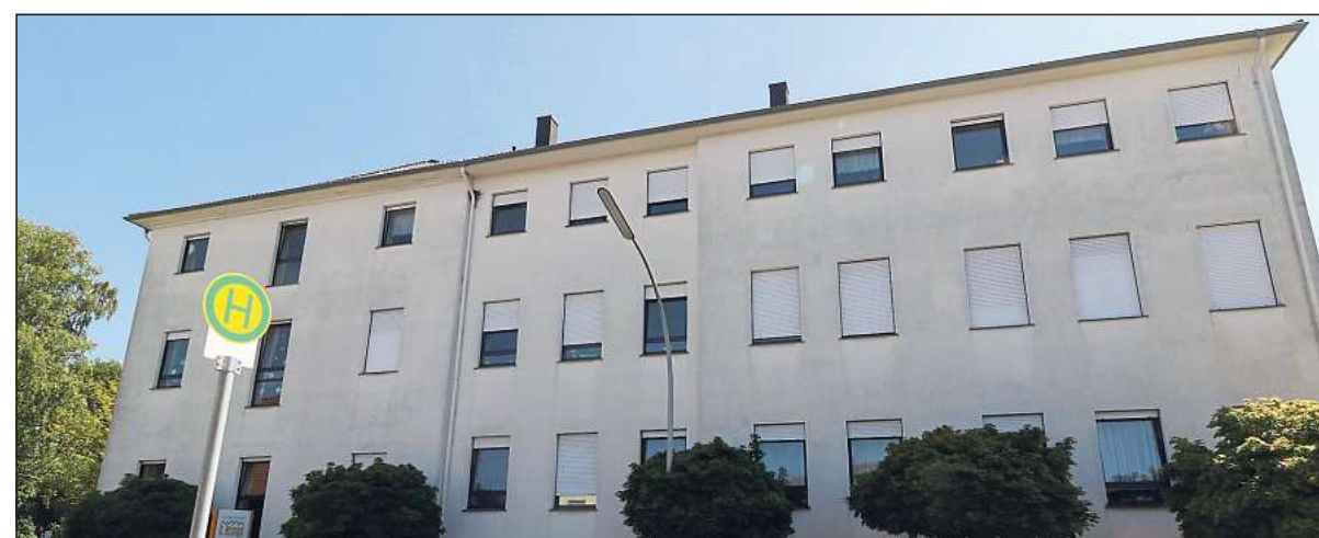
Insbesondere ältere Menschen sind nicht mehr so gut zu Fuß und fahren womöglich auch kein Auto mehr. Wie praktisch, dass der Dorfbus auch am Langenberger Seniorenheim hält.