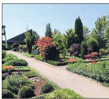
Die Gräber der Angehörigen auf dem Friedhof besuchen, erleichtert das Busangebot.